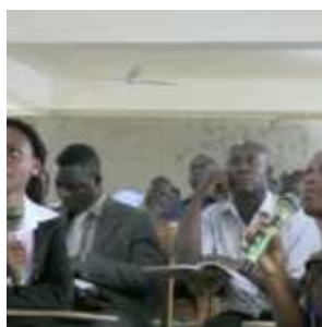
Mediatori di pace in Ghana.

Formazione dei mediatori di pace a Sunyani, Ghana. Nel 2012 è stato approvato il progetto con il Marian Conflict Resolution Center sui fondi FOSIT/DSC. Il progetto ha avuto il suo avvio amministrativo nel 2012, anche se le attività operative sono iniziate nel gennaio 2013.