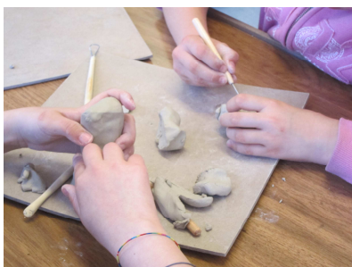
Realizzazione dei personaggi in ceramica.

Narrativa intergenerazionale e digitale per l'integrazione. Un progetto che ha coinvolto una quinta elementare della scuola Piccolo Principe di Lugano e due allieve della scuola speciale OTAF di Sorengo nello sviluppo di una versione in ceramica e poi digitale di una leggenda locale, raccolta da un ultracentenario della Capriasca. Sostenuto dalla Fondazione Margherita di Lugano e dalla Fondazione Del Don di Lugano.