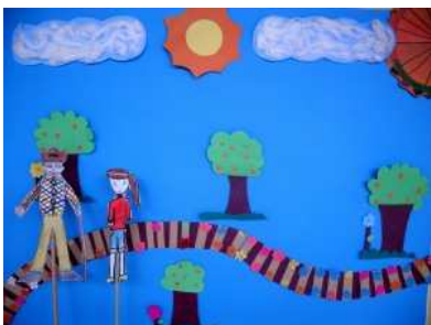
Storytelling a Brasilia.

Storytelling alla creche. Nell'ambito di questo progetto è stato allestito un laboratorio informatico nella creche dell'Associazione Nostra Signora Madre degli Uomini a Brasilia, ed è poi stato svolto un corso di formazione didattica e informatica per i docenti, che ha portato poi a un progetto con i bambini. Finanziato dal Comune di Bioggio e dal reinvestimento degli utili di seed. Questo progetto rappresenta un ulteriore passo di collaborazione con le realtà educative brasiliane vicine alla fondazione YES!.