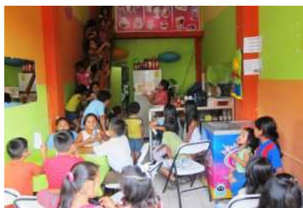
Cafeteria Arcobaleno a Catamayo, Ecuador.

Centro giovanile Arcobaleno a Catamayo. Si tratta dello sviluppo del progetto di formazione per microimprenditori tenuto nel 2010: uno dei progetti è stato portato alla realizzazione. Tre donne hanno aperto un centro giovanile e bar come luogo aggregativo a Catamayo. L'attività, che ha generato utili localmente, è stata sostenuta dal Cantone Ticino.